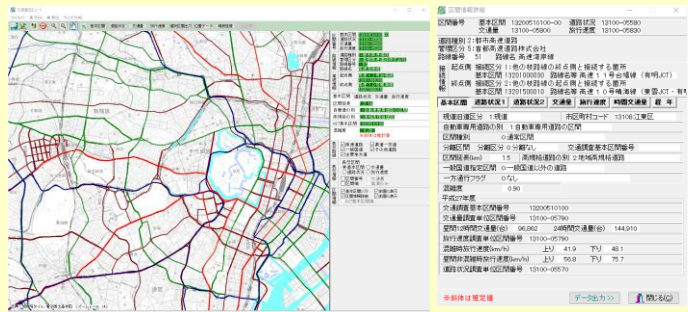
～掲載図はイメージです～

全国の交通調査基本区間、道路状況調査区間、交通量調査区間、旅行速度調査区間ごとに、交通量等調査データを一般財団法人日本デジタル道路地図協会の全国デジタル道路地図データベース上に表示します。 交通量以外の箇所別詳細データに合わせて過年度の主要指標データも表示可能です。 ※交通量図は、一般財団法人日本デジタル道路地図協会の全国デジタル道路地図データベース（令和3年3月版）に準拠しています。